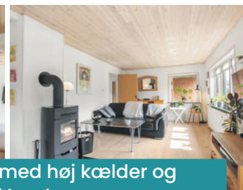
Rummelig villa med høj kælder og skoven i baghaven