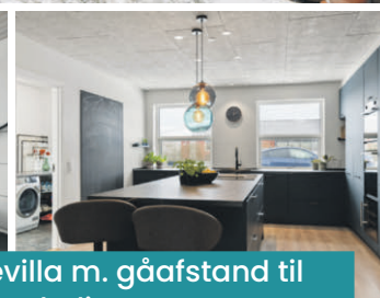
Rummelig familievilla m. gåafstand til skole og bylivet