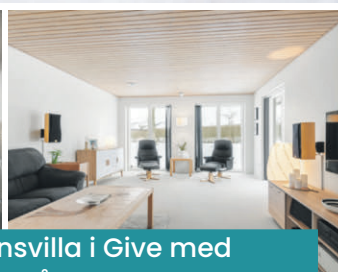
Moderne etplansvilla i Give med solceller på taget