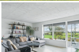
Flot moderniseret landejendom tæt på Give