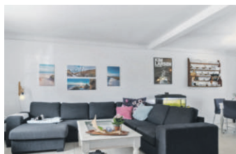
Velholdt moderniseret villa med nem, lukket have