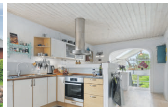
Velkomponeret villa med flot udsigt i Give