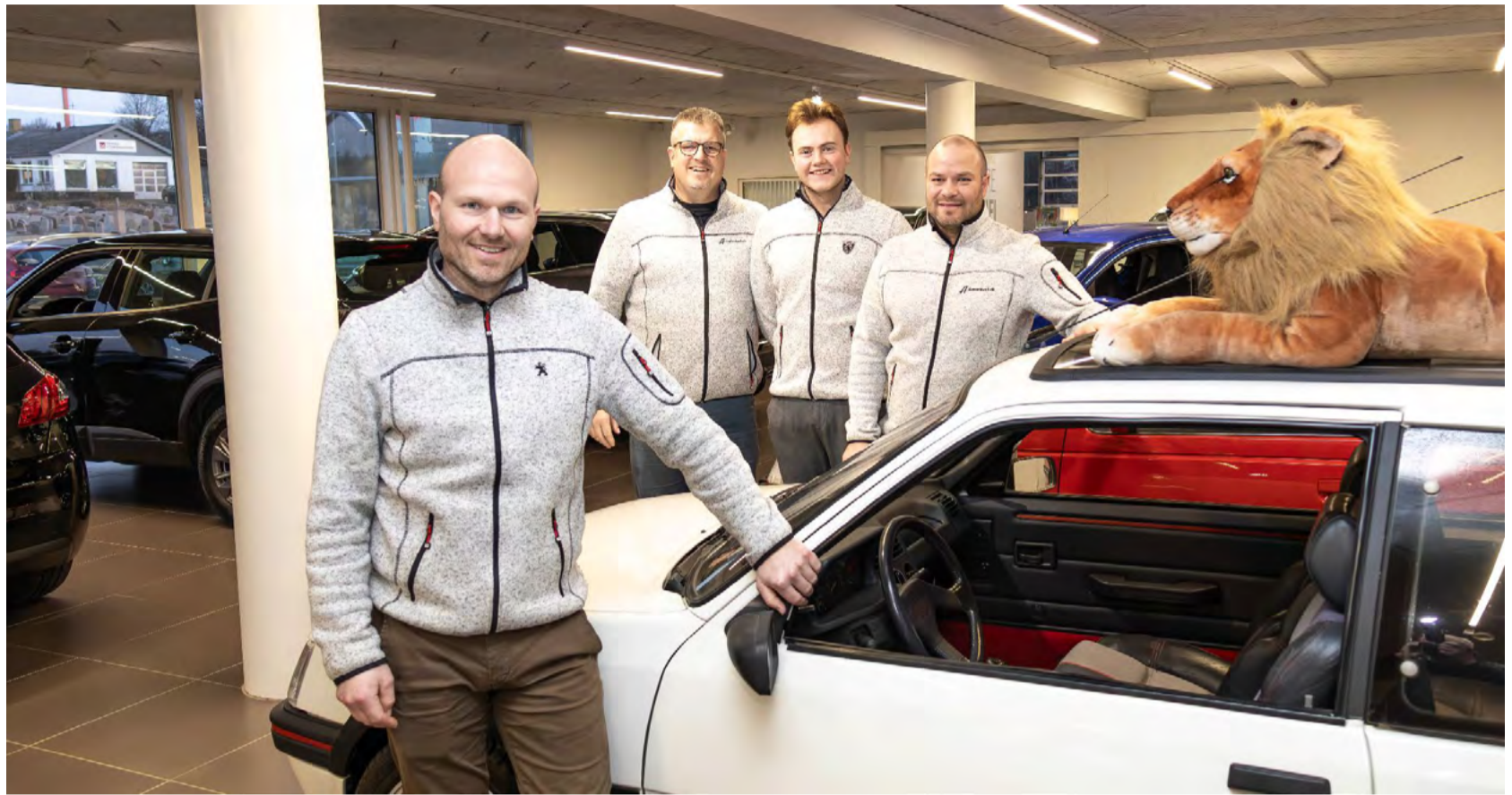
Salgsteamet hos A. Boesenbæk står klar fra 2. januar til at servicere kunderne - og der er masser af både spritnye og nyere brugte biler på lager.