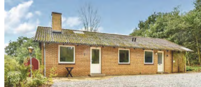
Tinnet Tinnetvej 57