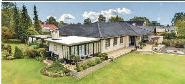
Give Drosselvej 7