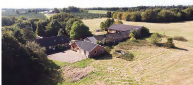
Knude Knudevej 10