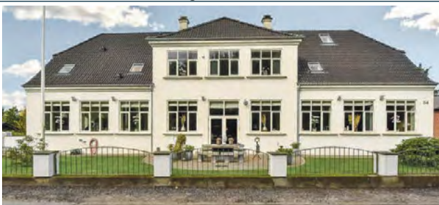
Vorslunde Vorslundevej 54