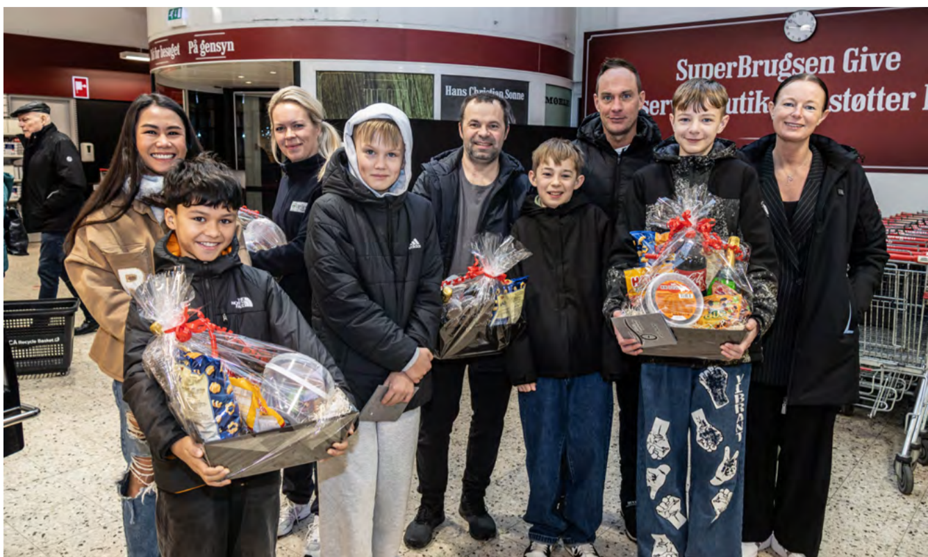
De fire redningsdrenge med deres mindst lige så stolte forældre.

De fire drenge ankom med brede smil og røde stolte kinder sammen med deres forældre, og de kunne fortælle, at de godt havde opdaget, at de var blevet "verdensberømte både i Give og Danmark". -Det er vildt fedt, at så mange har læst om os, og at de liker, det vi har gjort. I går var vi nede på Buffalo for at spise pizza, og her fik vi lige en gratis 1 ½ liters Fanta-sodavand af ejeren, fordi han syntes vi havde gjort noget rigtig godt, og så ville han takke os på den måde, fortæller drengene med stolthed i stemmerne. De har via deres forældre godt set al den positive virak, de har skab på eksempelvis Facebook, hvor de svømmer i likes og positive kommentarer.