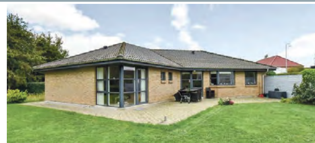
Give Troldeparken 28