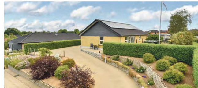
Gadbjerg Refshaven 51