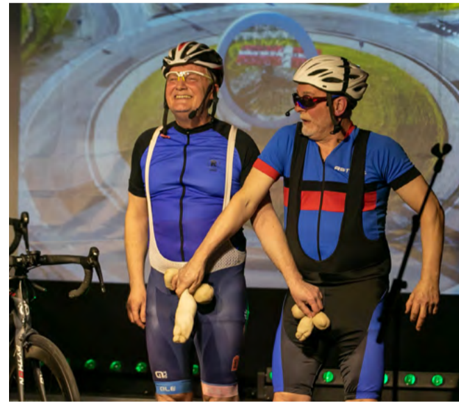
Var de lidt frække i 2023 i revyen i Give. Jeps, og sådan bliver det nok også i 2024.