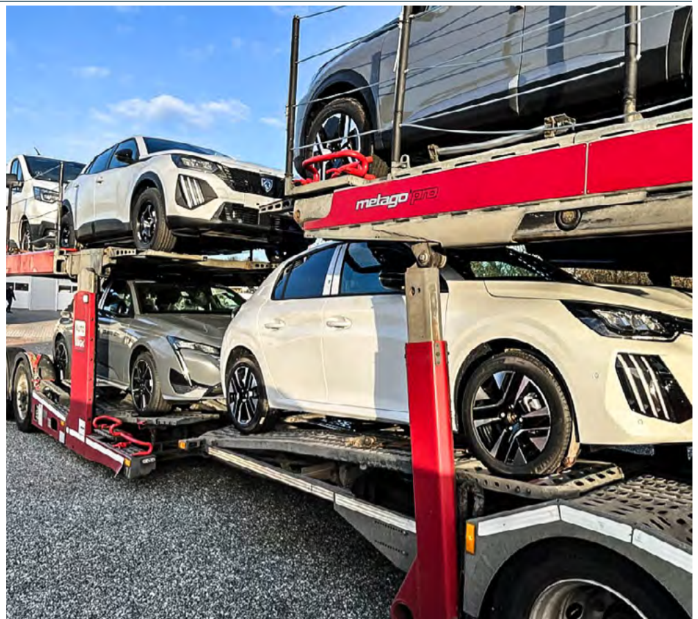
Den 22.12 væltede det ind med både nye og nyere brugte biler hos A. Boesenbæk, som er helt klar til et godt nytårssalg.

-For os er det vigtigt at bruge god tid sammen med kunderne, hvor vi får snakket med folk om deres bilsituation og den måde, de bruger bilen på. Det handler for os om at hjælpe kunden til at finde den helt rigtige bil ud fra kundens behov og kørselsforbrug. I dag er der jo så mange forskellige muligheder, når man køber bil, så det handler om at ramme plet, pointerer Alex. Og at ramme plet det skulle der så være rigtig gode muligheder for, når A. Boesenbæk 2. januar starter det nye år op med både nye spændende modeller og et velassorteret marked med nyere brugte biler.