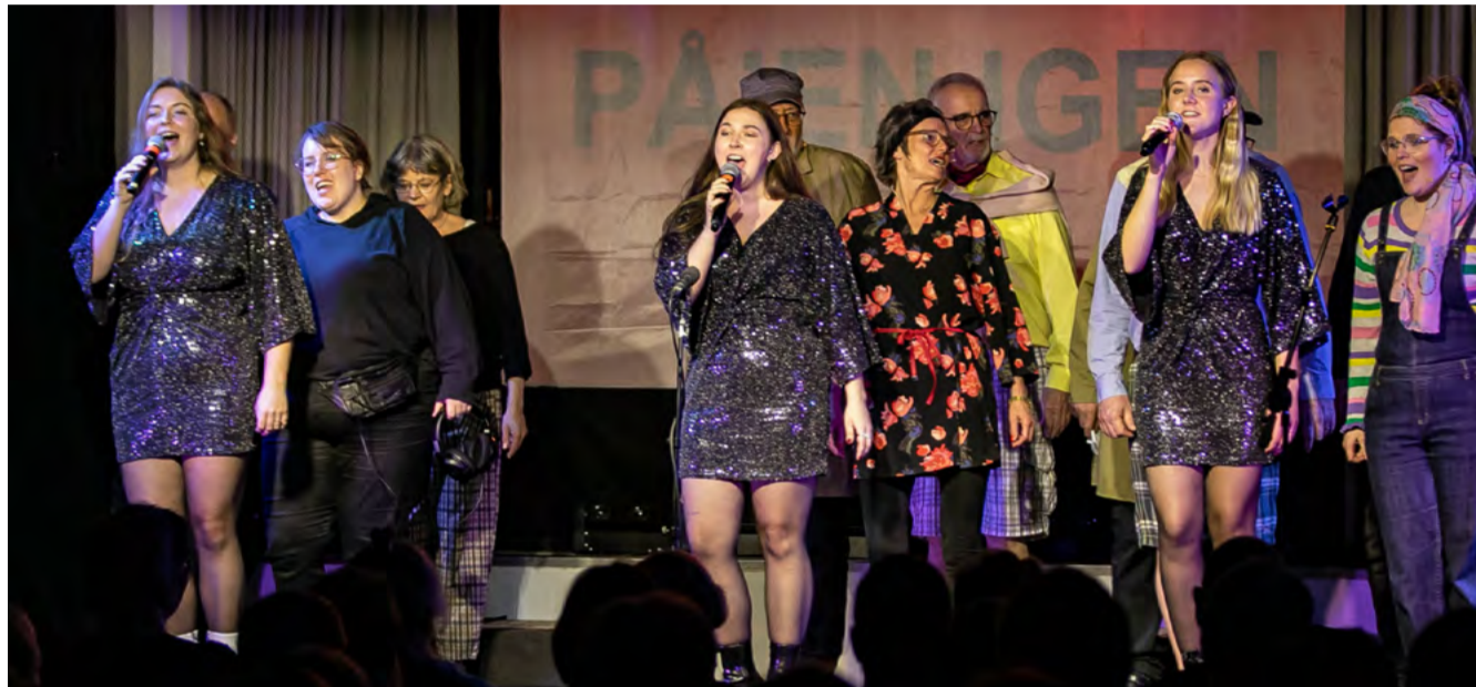
Give Revyen vender stærkt tilbage i 2024 – igen med en masse sjove løjer og gode vanvittige indfald.

VI skal hilse fra holdet og sige, at billetter til revyen sættes til salg medio januar 2024.