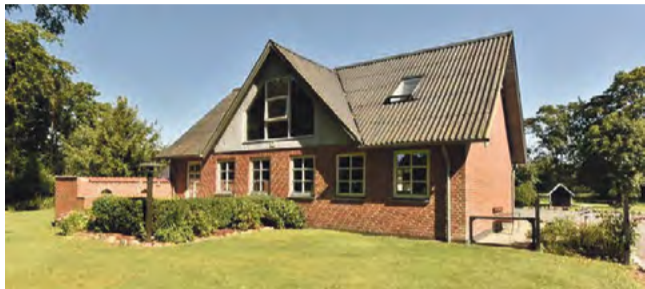
Thyregodlund Ålbækvej 23