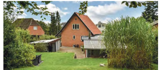
Give Niels Kjeldsensvej 6