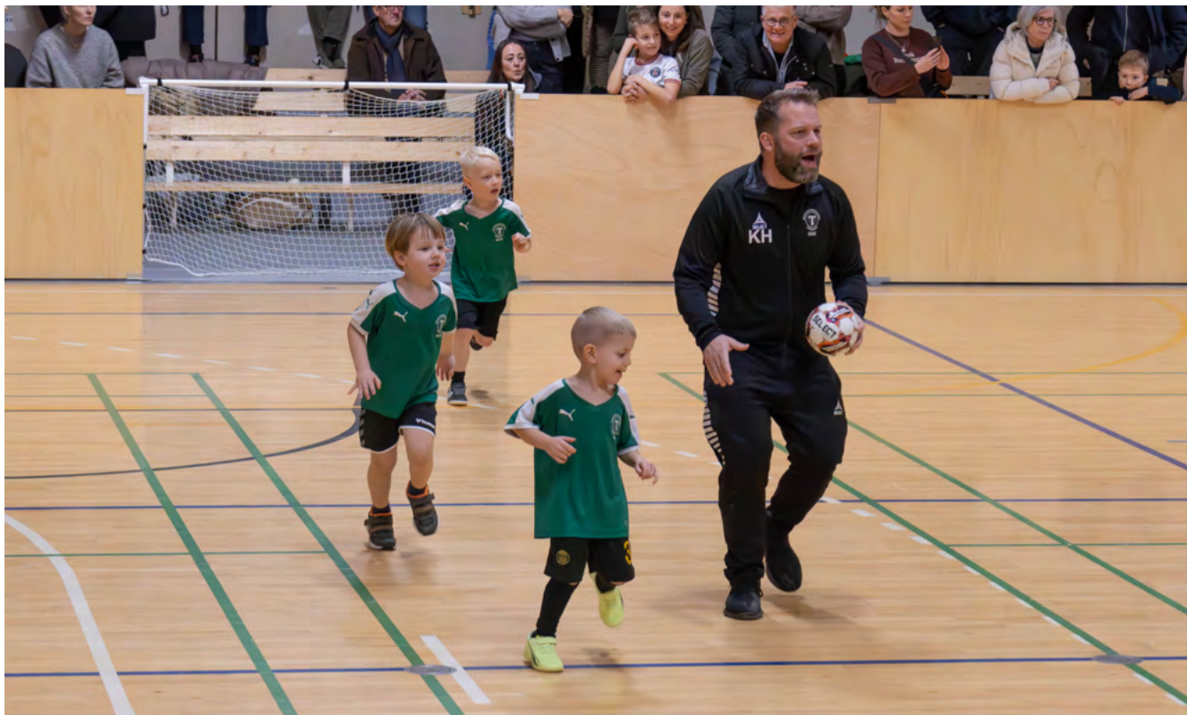
Give Fremad havde naturligvis også selv en lang række hold med til Dan Cake Cup. Her nogle af de mindste fodboldkrigere - med hjemmebanedommer.

- Det var et perfekt stævne. Overordnet set klappede alt, som det skulle. Naturligvis var der også nogle få udfordringer, der skulle løses hen ad vejen. Ikke mindst vejret spillede os et puds, idet det barske vintervej og det glatte føre betød, at i alt 8-9 hold primært fra aarhusområdet desværre måtte melde afbud.