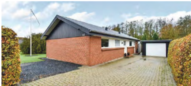
Give Hyldevang 142