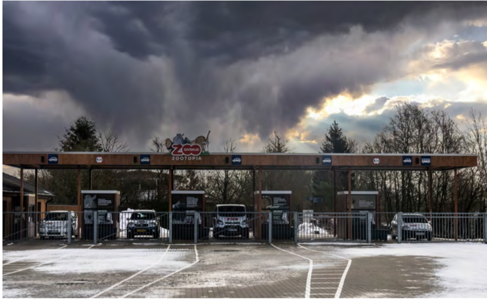
I forbindelse med det massive snevejr er det gået hårdt ud over træer og buske i Givskud Zoo, hvor et team på 5 mand nu arbejder med at frigøre stier og vej.

- Sneskaderne er så omfattende, at vi har kaldt ekstra mandskab ind til oprydning, og det vil desværre tage