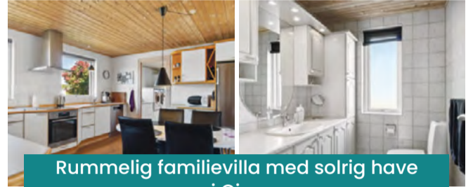
Rummelig familievilla med solrig have i Give

Give Hyldevang 147 Villa På en stille, lukket vej ligger denne villa på 176 kvadratmeter fordelt på køkken-alrum, bryggers, badeværelse og gæstetoilet samt seks værelser og en sydvendt have. Her bor I tæt på institutioner, skole og Give by, og med let adgang til motorvejen. Kontant: 1.995.000 Bolig m 2 : 176 Grund m 2 : 776 Ejerudgift pr. md.: 2.136 Stue/Vær.: 1/6 Udhus: 10 Udbetaling: 100.000 Byggeår: 1973/01 Garage: 48 Brt./Nt. ekskl. ejerudg.: 11.543/9.380 Sag: 0670000475 Energi C