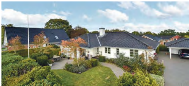
Give Agerbølparken 27