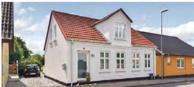
Give Rådhusbakken 17