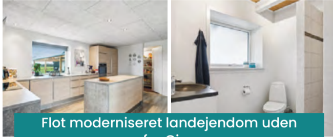
Flot moderniseret landejendom uden for Give

Give Vejlevej 235, Lønå Villa Det er kun få kilometer nord for Give, at I nu kan overtage denne velkomponerede og aldeles rummelige landejendom, som rummer oceaner af plads til familien, hobbyaktiviteter, store sammenkomster og det rene afslapning i naturskønne omgivelser. Kontant: 1.995.000 Bolig m 2 : 183 Grund m 2 : 4.226 Ejerudgift pr. md.: 1.646 Stue/Vær.: 1/4 Udhus: 41 Udbetaling: 100.000 Byggeår: 1924 Garage: 112 Brt./Nt. ekskl. ejerudg.: 12.256/9.812 Sag: 0670000555 Energi B