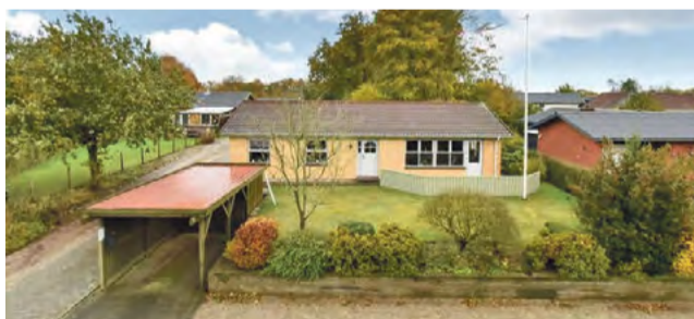
Givskud Stadionvej 22