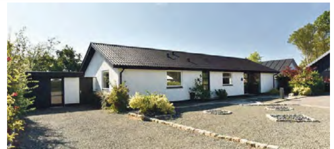
Give Agervang 11