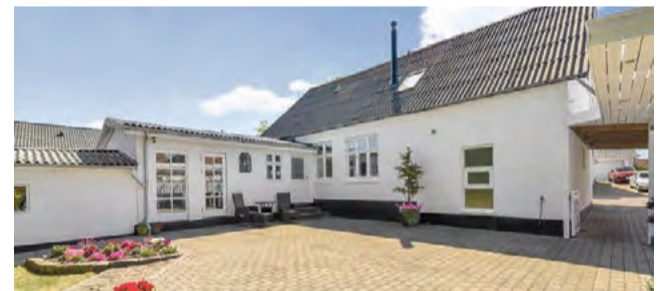
Give Frederiksberggade 34