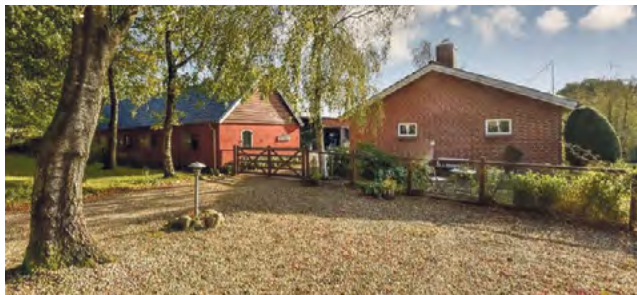
Førstballe Førstballevej 38