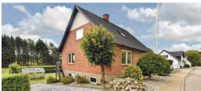
Hedegård Hedegårdvej 39