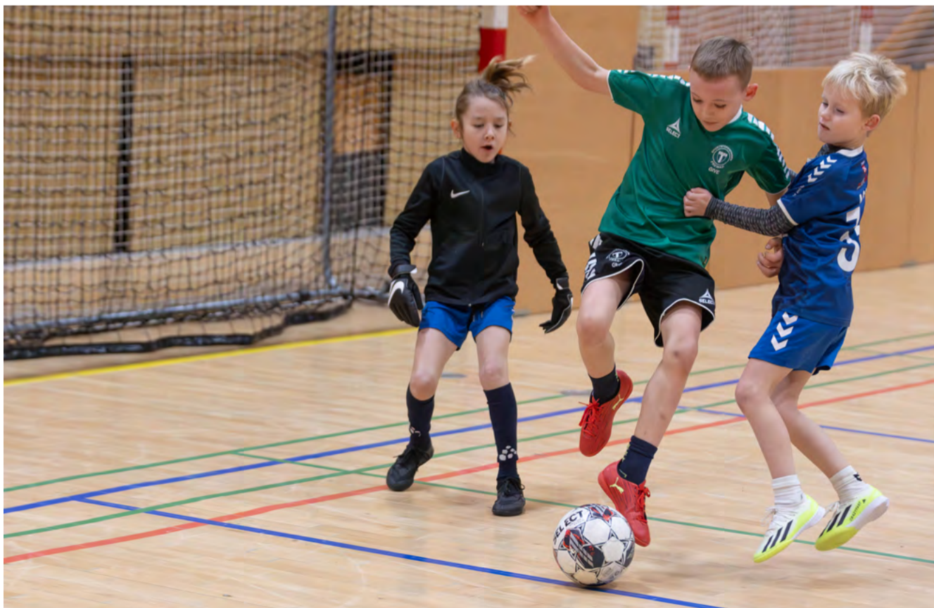
Der blev spillet en masse god fodbold i 6 haller, hvor i alt 341 hold boltrede sig til Dan Cake Cup 2024., som blev et rekordår.

- Det vil vi godt hemmeligholde et par uger endnu, men vores bidrag vil sikkert gøre godt på et sted, hvor rigtig mange fodboldspillere vil få glæde af det, lyder det hemmelighedsfuldt med et smil fra Johnny.