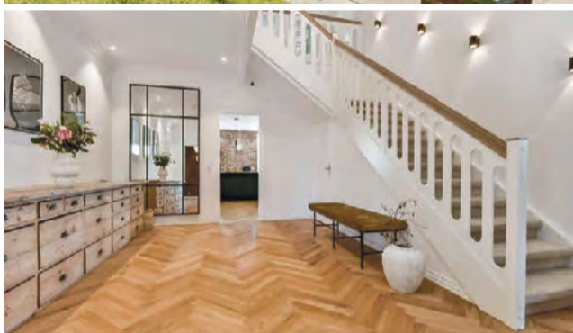
Give Fredensgade 2