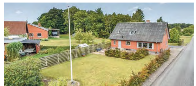
Uhe Åbjergvej 1