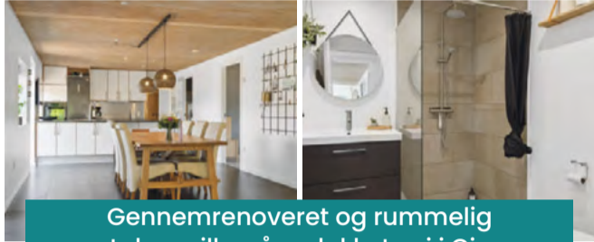
Gennemrenoveret og rummelig etplansvilla på en lukket vej i Give

Give Hyldevang 216 Villa Denne dejlige villa er beliggende på lukket vendeplads med kvarterets legeplads tæt på. Boligen er siden 2019 gennemgribende renoveret, så I kan flytte direkte ind. Der er masser af plads med hele fem værelser, to badeværelser og et stort, lyst opholdsmiljø. Kontant: 2.695.000 Bolig m 2 : 196 Grund m 2 : 962 Ejerudgift pr. md.: 2.169 Stue/Vær.: 1/5 Carport: 70 Udbetaling: 135.000 Byggeår: 1987/99 Brt./Nt. ekskl. ejerudg.: 16.509/13.217 Sag: 0670000395 Energi B