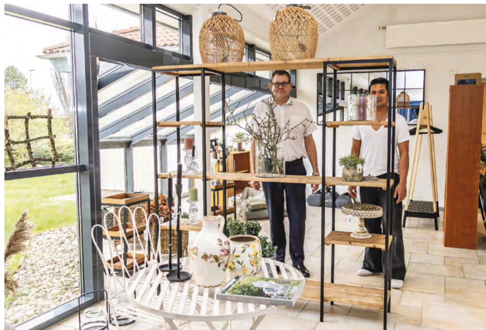
Home Feeling butikken tilbyder både brugskunst og boligtekstiler, og som man kan se her også effekter til udelivet.