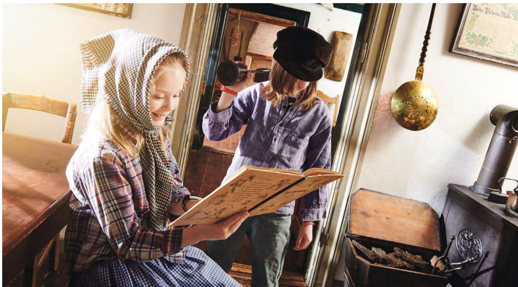
Museum Give slår den 3. maj dørene op til udstillingen 'På kanten af en ny tid', hvor man inviteres med tilbage til starten af det tyvende århundrede på slægtsgården Nygård på Vejle Vestereg.

Den første halvdel af 1900-tallet førte store forandringer med sig for befolkningen her. De stod på kanten af en ny tid. Hedeopdyrknin-gen var endelig lykkedes, og hedeboenderne kunne nu i højere grad end tidligere drive landbrug med dyreavl og kartoffelproduktion. I første omgang til eget brug, men siden med henblik på videresalg. En stemning af iværksætter og virkelyst prægede egnen. Med personfortællingerne i centrum, autentiske rekvisitter og gården som unik ram-