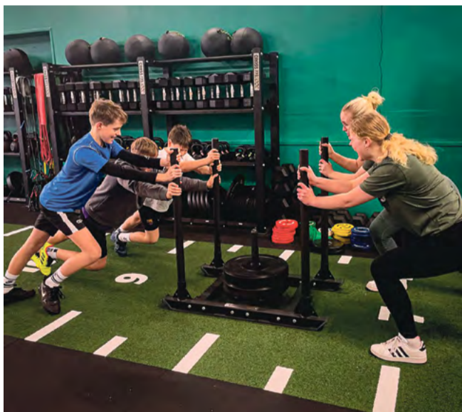
Fra lørdag den 4. maj er der mulighed for at komme med til crossfitnesstræning i Gullestrups Have.