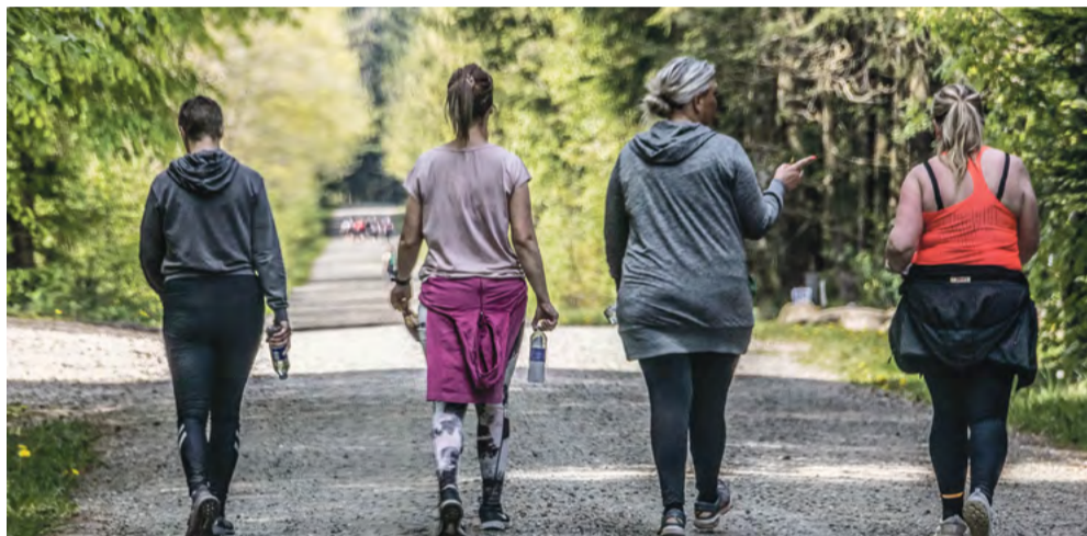
Den 19. maj inviteres der igen til Walk A Fun-Thon med Mette og Loa som værter.

Billetterne kan også købes på dagen. Man kan også købe sin billet online via Give GIFs hjemmeside.