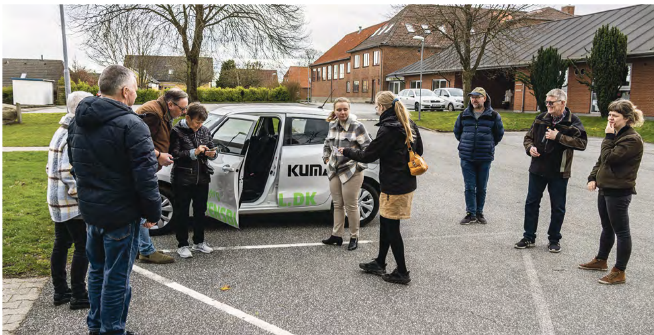
Nu har Gadbjerg fået en delebil, akkurat som Givskud, og den og konceptet blev præsenteret tirsdag aften i sidste uge.

I 2015 fik Arne så ideen om en delebil i Højmark, og da andre ikke gjorde noget ved sagen, sprang han selv til og realiserede konceptet. -En delebil i Højmark gjorde