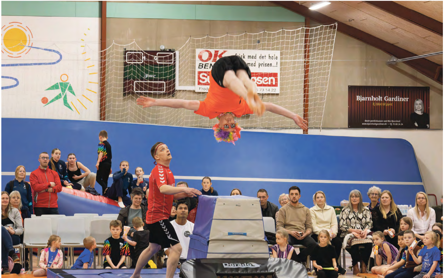
Gymnastikopvisningen i Vonge havde rigtig flot opbakning fra publikum, der var med til at skabe en rigtig fin dag i gymnastikkens tegn.

VONGE: Det blev en rigtig festdag, da gymnastikafdelingen i Øster Nykirke IF åbnede dørene til Vonge-Kollemortenhallen lørdag eftermiddag i sidste uge. Der stod gymnastikopvisning på plakaten, og det er en event, der i den grad kan trække folk af huse, selvom om vejret inviterede til havearbejde og grill på terrassen.