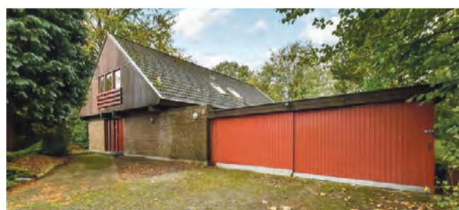
Give Villavej 15 Sagsnr. 501-5052