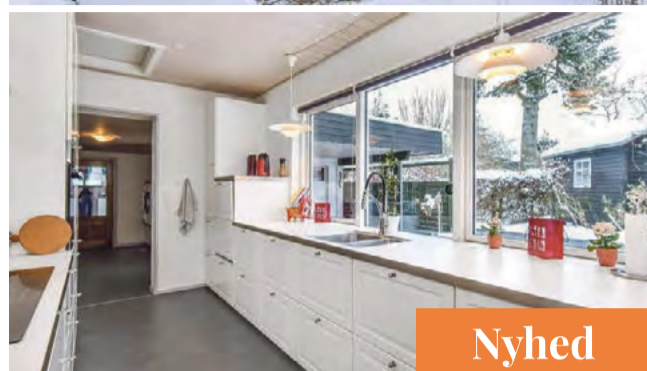
Give Villavej 3F Sagsnr. 501-5163