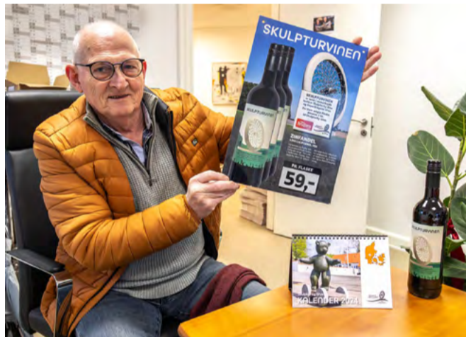
Skulpturbyen er klar med slag af kalendere hos Give Bog og Leg og i Brugsen.

-Ved du hvordan, det gik tyven, der stjal en kalender? -Øøøøh, nej? -Han fik 12 måneder.