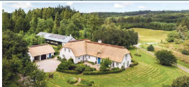
Sejrup Horsbjergvej 5 Sagsnr. 501-4954