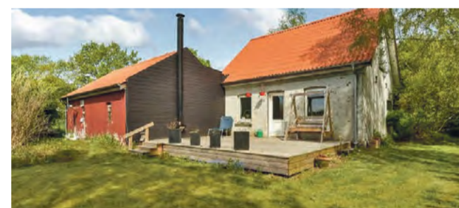
Give Vejlevej 227 Sagsnr. 501-4198