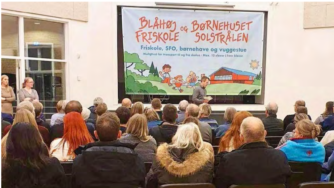
Efter cirka halvanden års kæmpearbejde kunne friskolegruppen bekendtgøre lederen af Blåhøj Friskole og Børnehuset Solstrålen.

Vi ønsker den gode, anerkendende dialog mellem den voksne og barnet som grundlæggende i undervisningen og i livet på skolen. Vi ser det som et fælles ansvar, at alle føler sig en del af fællesskabet og føler sig værdsat. På Blåhøj Friskole og Børnehuset Solstrålen giver vi børnene en rygsæk som fyldes med livsvigtige redskaber og minder for livet!