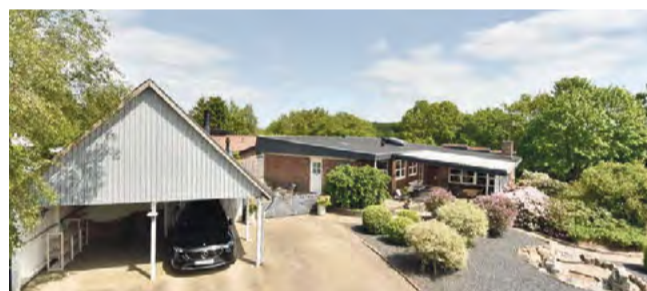
Give Agerbølparken 61 Sagsnr. 501-4988