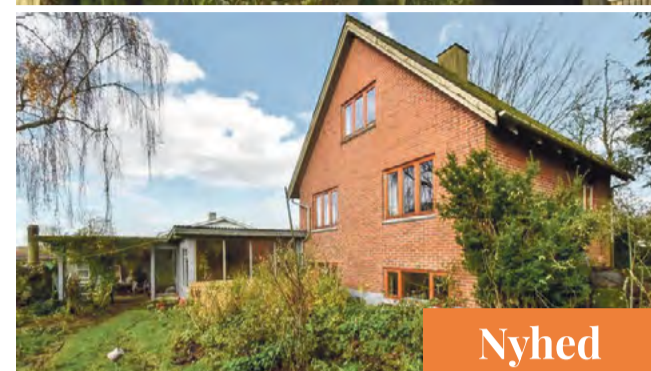
Givskud Seidelinsgade 18 Sagsnr. 501-5134