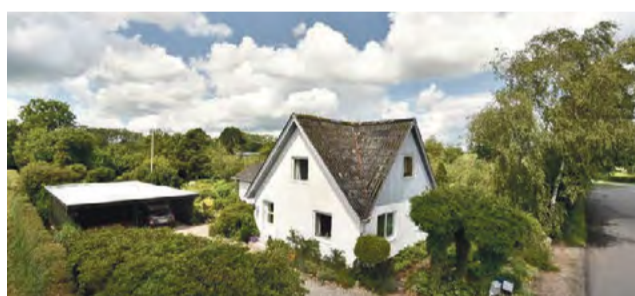
Farre Bækvej 23 Sagsnr. 501-4965