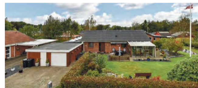
Thyregod Skovlunden 115 Sagsnr. 501-5095