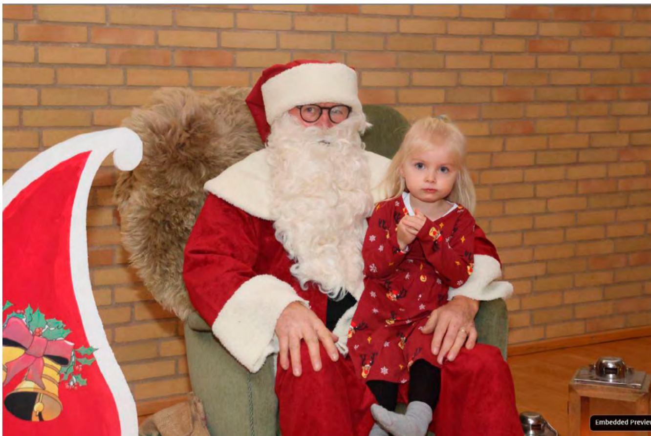
Julemanden kiggede naturligvis fobi. Da Grønbjerg-Langelund holdt stor juletræsfest i Elkjærhallen.

PS: Det gjorde den gode gårdnisse altså også, smiley. På denne fine og muntre facon blev det således jul i Grønbjerg-Nisselund – og så må den gode julemand altså hjem og spise op ad risalamande-skålen, så han til næste år kan møde op i topform.